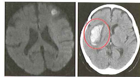
図1.頭部CT.○の部分は脳出血 図2.頭部MRI.白い部分は脳梗塞